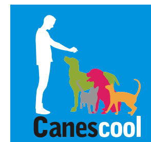
Logotipo sobre fondo negro escala de grises