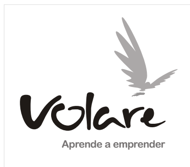
Logotipo sobre fondo blanco escala de grises